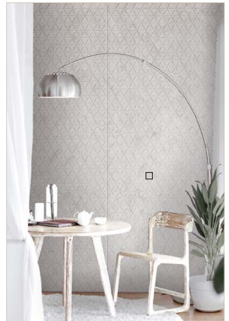
□ FL CUBE VELVET Pearl