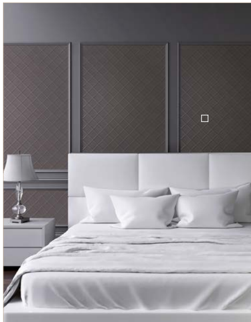
□ LL CORD Charcoal Light