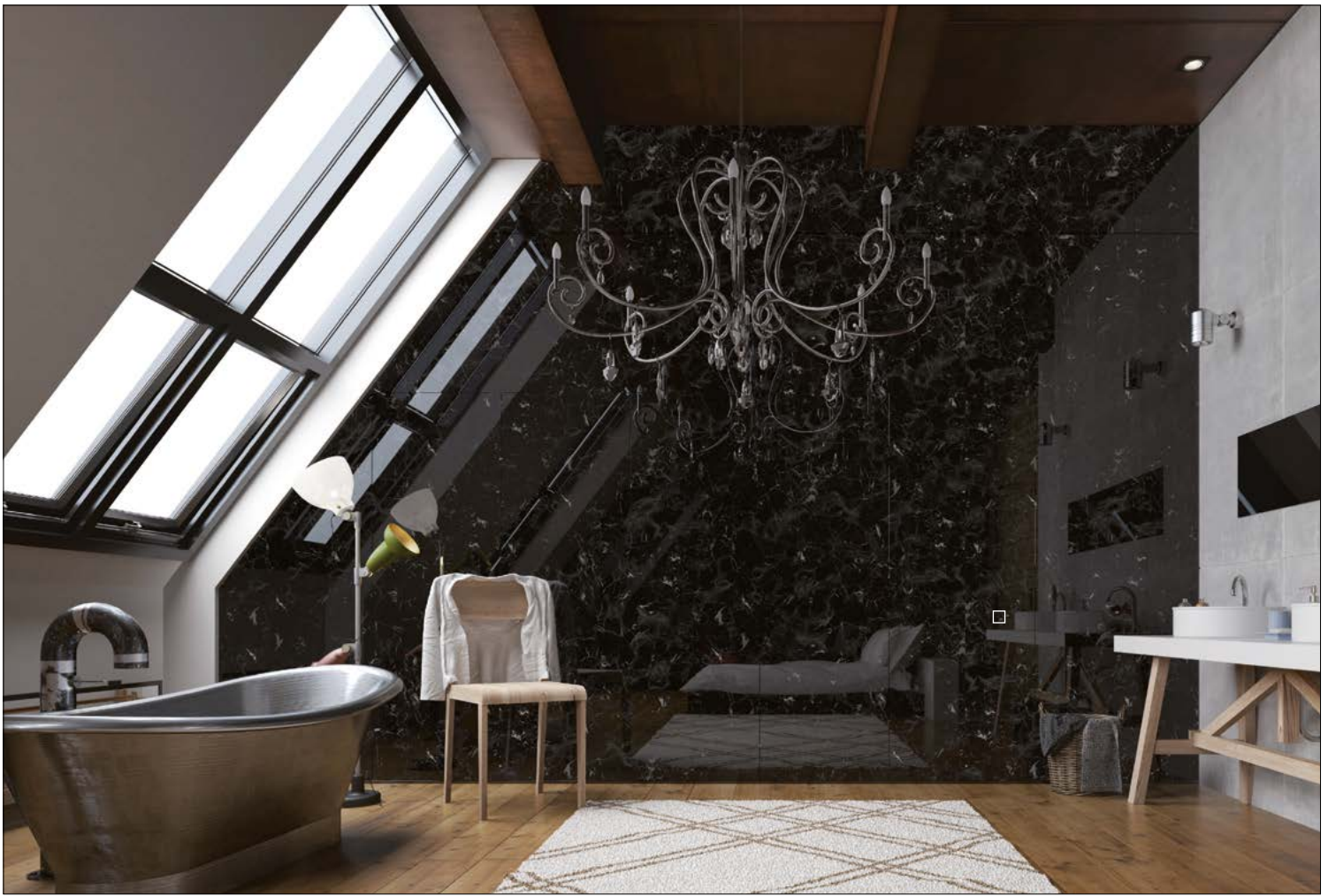
□ SG MARBLE Black AR+