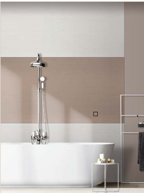
□ BA TIMBER Sesame matt AR